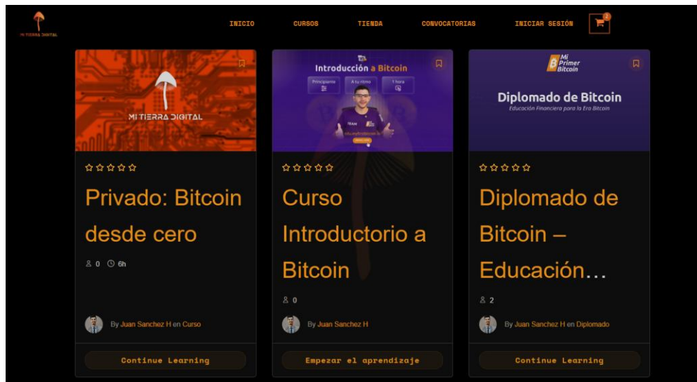
Plataforma de educación virtual mitierradigital.com/cursos

Dos de tres programas fueron diseñados por la organización MyFirstBitcoin bajo metodologías de aprendizaje accesibles, participativas y orientadas al fortalecimiento de capacidades comunitarias y territoriales.